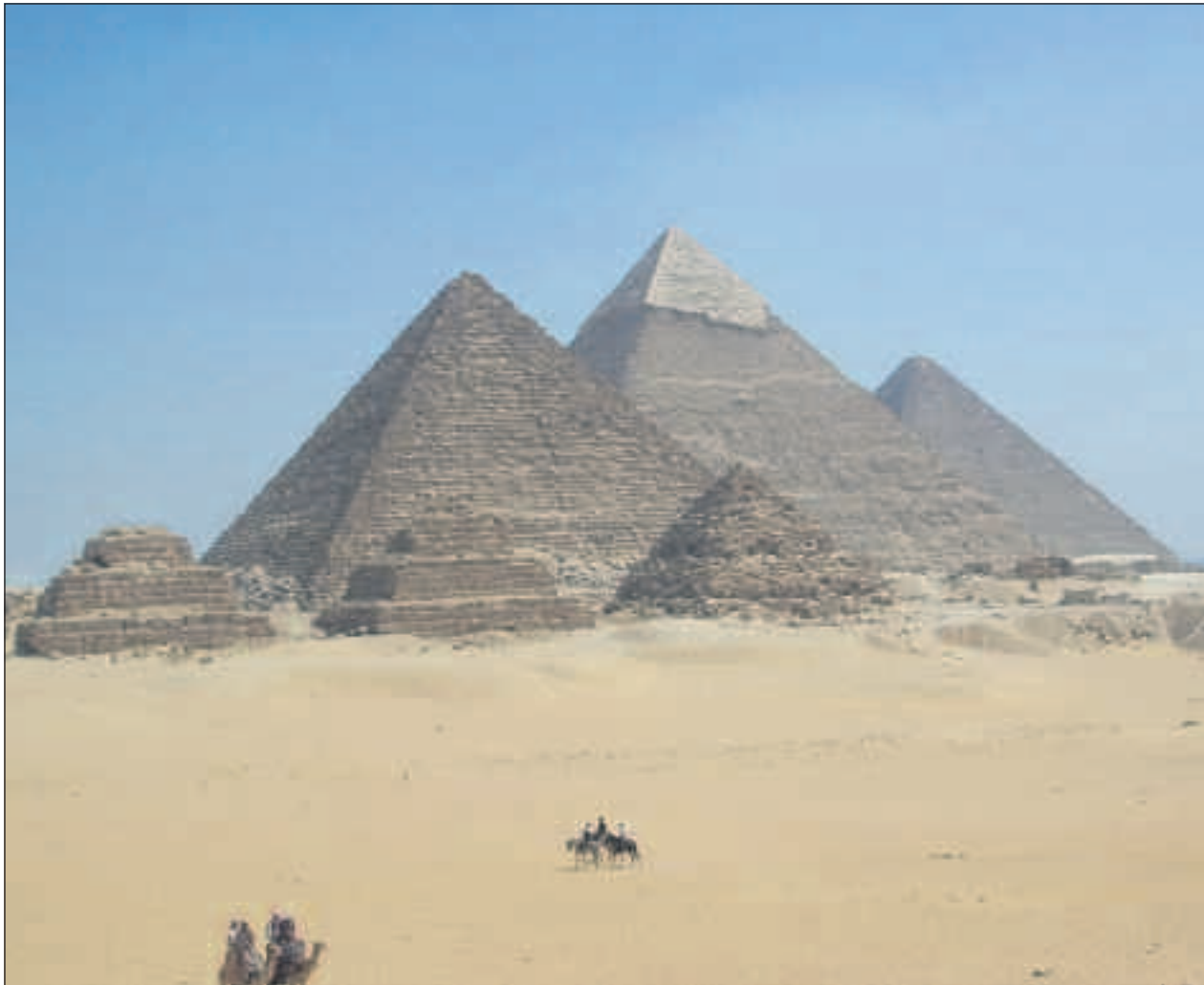
Le voyage commencera bien entendu par la visite des pyramides.