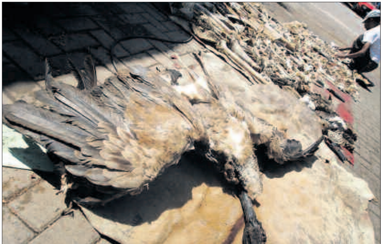
Dans 20 ou 30 ans, les vautours pourraient être amenés à disparaître. On ne pourra plus alors utiliser leur cerveau qui paraît-il, "permet de voir des choses"...

« Je ne crois pas que ce truc vous donne des visions », finit par lâcher le nyanga, avant de trancher: « de la chance oui, mais pas de visions ».